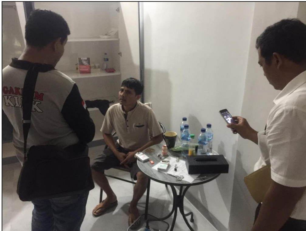
Tim Operasi Gabungan melakukan Penyergapan pada CP di sebuah Penginapan di daerah Tanjung Gading Kec. Tanjung Karang Timur Kota Bandar Lampung