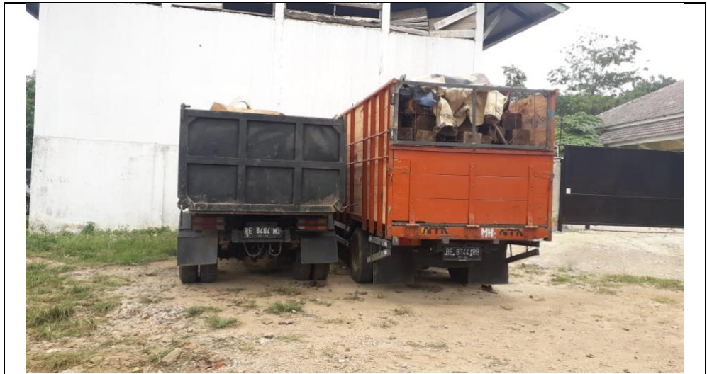
Gambar 4. Barang Bukti